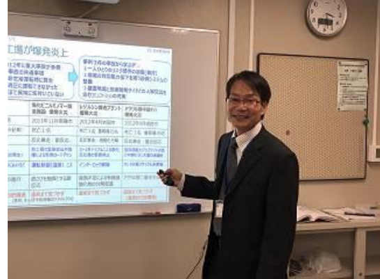
(実施日：令和元年12月9日、場所：新居浜工業高等専門学校)

新居浜市立別子中学校17名を対象とした「ものづくり体験講座」第3コマ 企業人魅力発見講座「ものづくりのやりがい・楽しさ」において、講義を実施した。