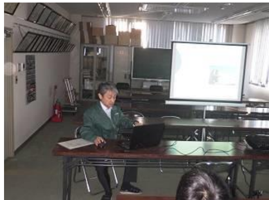
(実施日：令和元年10月28日、場所：株式会社アイワ技研 本社)