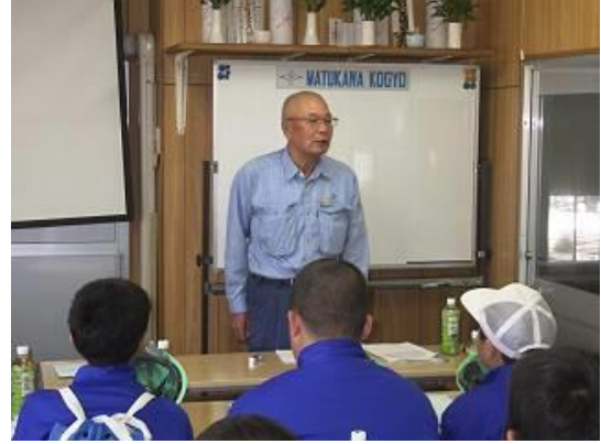
(実施日：令和元年10月28日、場所：有限会社松川工業 黒島工場)