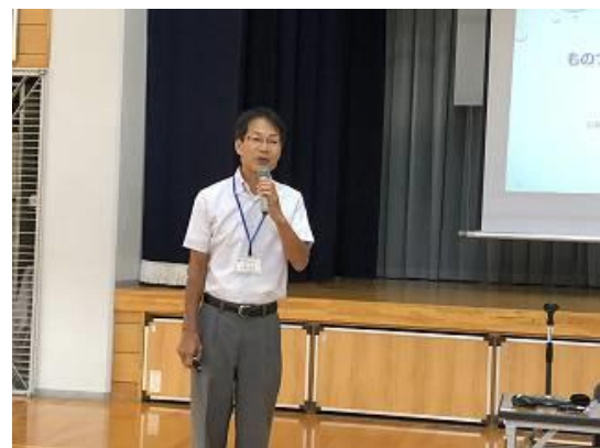
(実施日：令和元年9月25日、場所：新居浜市立別子中学校)